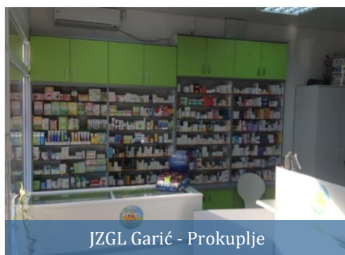
JZGL Garić - Prokuplje