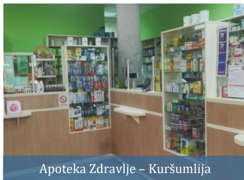
Apoteka Zdravlje - Kuršumlija