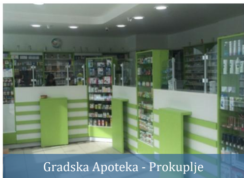
Gradska Apoteka - Prokuplje