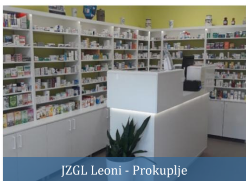
JZGL Leoni - Prokuplje