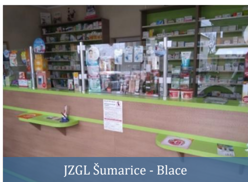
JZGL Šumarice - Blace