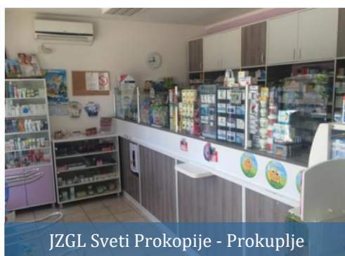
JZGL Sveti Prokopije - Prokuplje